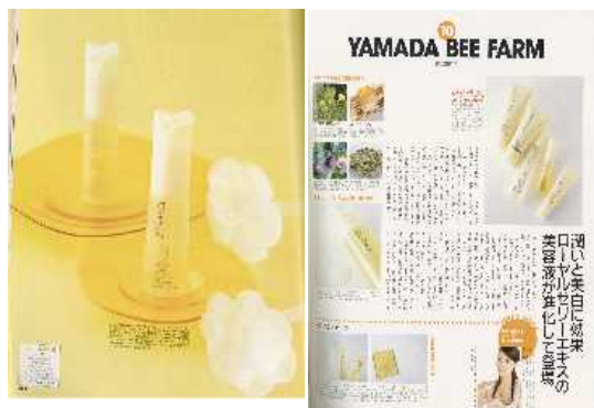
(前年の企画ページから)