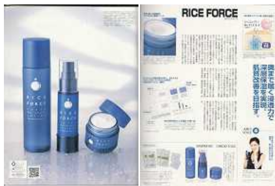
(前年の企画ページから)